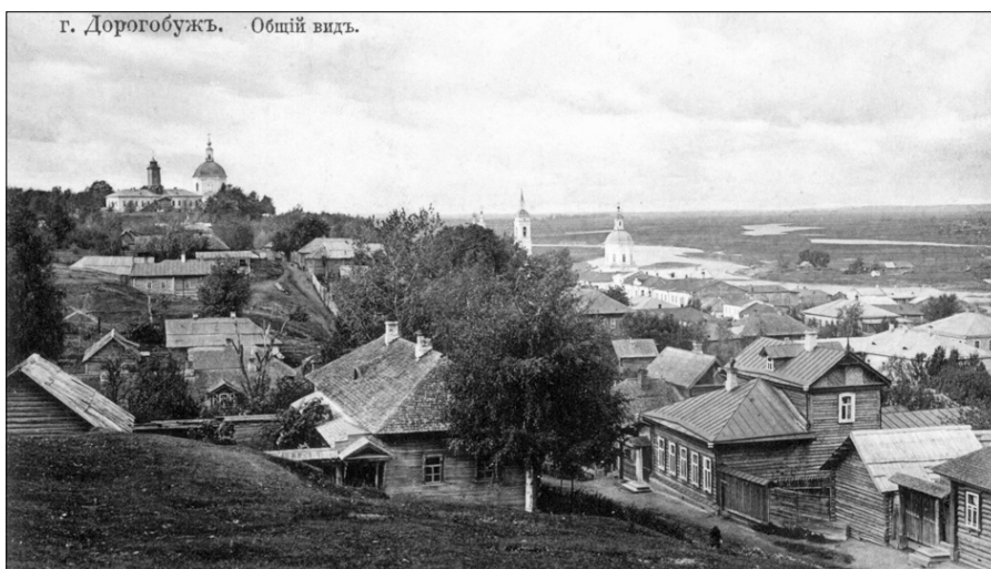
Вид на город Дорогобуж с Дмитровского вала. Почтовая открытка, 1912 г.

Первым сигналом к открытию боевых действий служил выкрик нескольких голосов с одной какой-либо более подготовленной к выступлению стороны: «Давай! Давай! Давай!» – зазывали протяжными голосами вояки. Вслед за этим сигналом начинали, медленно надвигаясь, приближаться «армии» одна к другой, чувствуя себя как-то боязненно-нерешительными. Впереди находились обычно более отважные, как это бывает и везде. Они имели засученные рукава, сжатые кулаки и присерьезно-сердитые выражения лиц. Наконец, противники сходились вплотную и начинали «работать»! Каждый боец ударял то одним, то другим кулаком первого попавшегося под руку «неприятеля» по чему попало, входя все более и более в азарт. Обессилевшие через некоторое время в бою или струсившие и не желавшие быть изрядно избитыми, иметь синяки, очутиться в крови, падали на землю. Это был знак примирения (сдача на «капитуляцию»), после чего они не