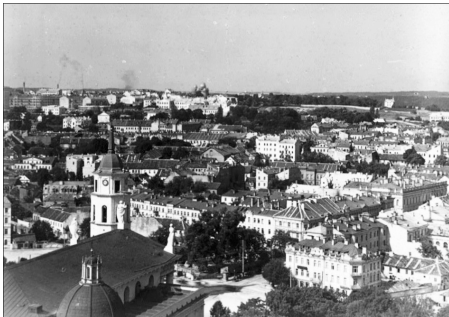
Вильна. Общий вид с северо-востока с Замковой горы. 1912 г.

я старался избавиться, выйти из такого зависимого положения путем приобретения дома с землей, т.е. обзаведением собственного гнезда, чтобы возможно было жить самостоятельно и более спокойно.